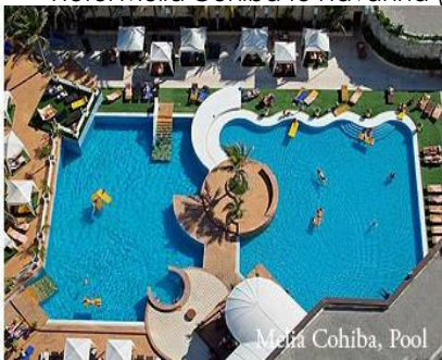
Melia Cohiba, Pool

*****Hotel Melia Cohiba te Havanna (logies & ontbijt)