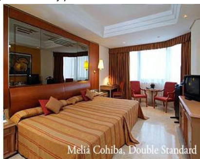
Melia Cohiba, Double Standard

5 Sterren hotel, een van de beste hotels van Havana, gekend voor de uitstekende service. Gelegen aan de gekende Malecon, op 6km van oud Havana en 16km van de luchthaven. Vlakbij Plaza de la Revolucion.